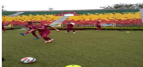
Sesiones de entrenamiento y partidos selección Infantil Tolima Infantil U-13