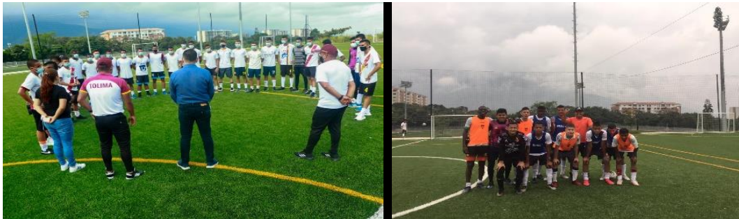
Sesión de Entrenamiento Selección Tolima Prejuvenil Masculina U-15