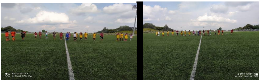
Sesión de Entrenamiento Selección Tolima Prejuvenil Femenina U-15

Los eventos realizados y programados en diferentes categorías y géneros se describirán a continuación: