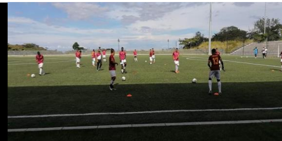
Sesiones de entrenamiento y partidos selección Juvenil Masculina U-17